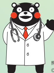
熊本県PRキャラクター「くまモン」 ©2010 熊本県くまモン#K36867