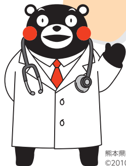
熊本県PRキャラクター「くまモン」 ©2010熊本県くまモン#K36867